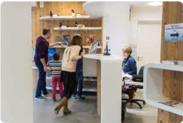
À La Chevrolière 16 rue Yves Brisson