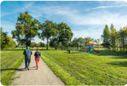
Le parc des Prés du Bourg LE BIGNON

Nos spots nature sont idéaux pour une courte balade en famille ou un pique-nique dans un cadre bucolique.