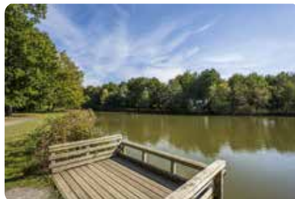
Le plan d'eau de Chantemerle MONTBERT