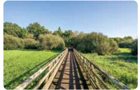
Le Site de la Chaussée LA CHEVROLIÈRE