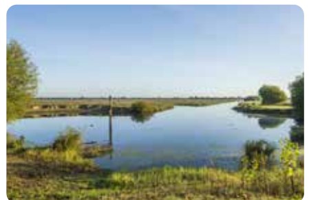
Canal du Grand Port SAINT LUMINE DE COUTAIS