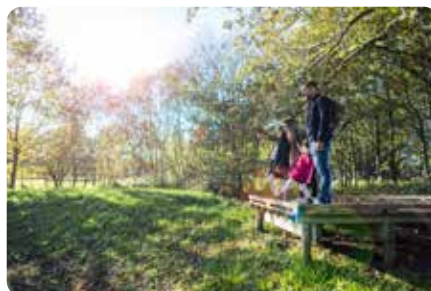
La réserve naturelle des Cailleries SAINT COLOMBAN