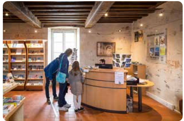
À Saint Philbert de Grand Lieu 2 place de l'abbatiale