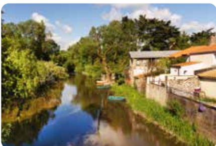
Le quai des romains PONT SAINT MARTIN