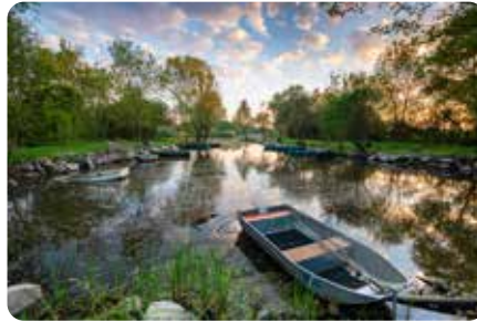
Le port des Roches à Trejet LA CHEVROLIÈRE