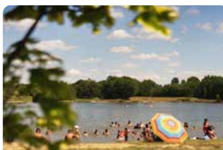
Le parc de la Boulogne SAINT PHILBERT DE GRAND LIEU