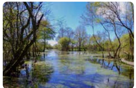
Le Marais de l'île PONT SAINT MARTIN