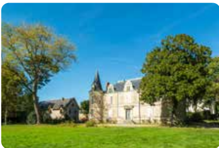
Le plan d'eau et parc du château GENESTON