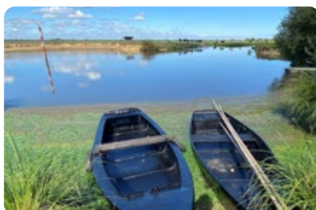
Canal du Grand Port SAINT LUMINE DE COUTAIS