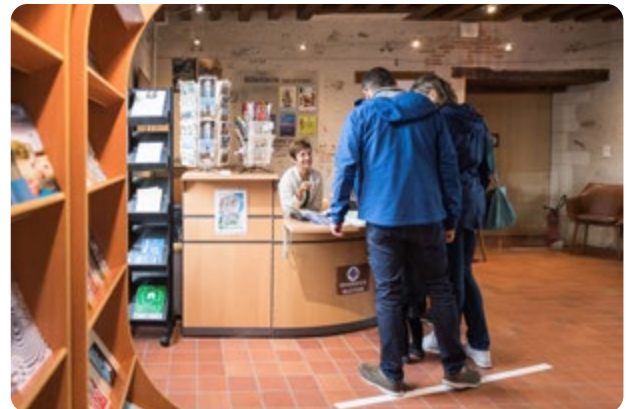
À Saint Philbert de Grand Lieu 2 place de l'abbatiale