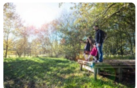
La réserve naturelle des Cailleries SAINT COLOMBAN