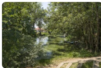
Le quai des romains PONT SAINT MARTIN