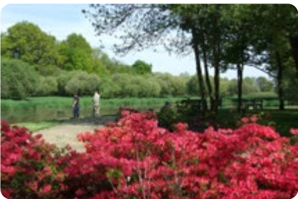
Le Site de la Chaussée LA CHEVROLIÈRE