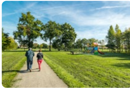
Le parc des Prés du Bourg LE BIGNON