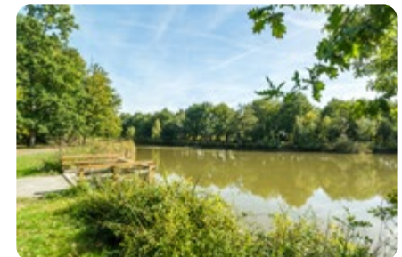
Le plan d'eau de Chantemerle MONTBERT