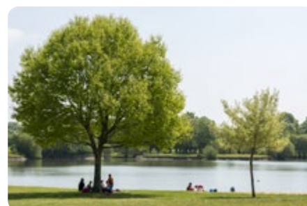
Le parc de la Boulogne SAINT PHILBERT DE GRAND LIEU