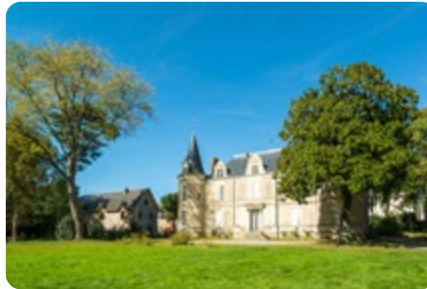
Le plan d'eau et parc du château GENESTON