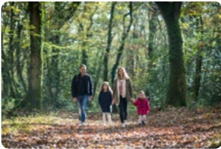
La forêt de Touffou LE BIGNON

Nos spots nature sont idéaux pour une courte balade en famille ou un pique-nique dans un cadre bucolique.