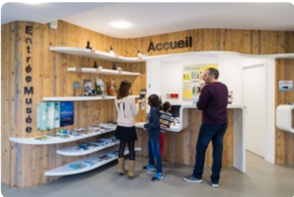
À La Chevrolière 16 rue Yves Brisson