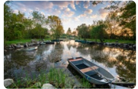
Le port des Roches à Trejet LA CHEVROLIÈRE